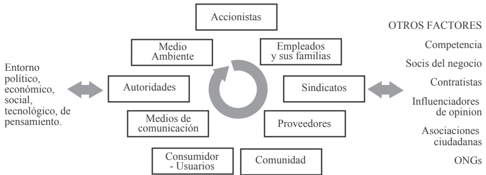
Figura 3: Radio de acción de los multistakeholders .